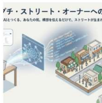
【ページ作り】プチ・ストリート・オーナー カウンセル