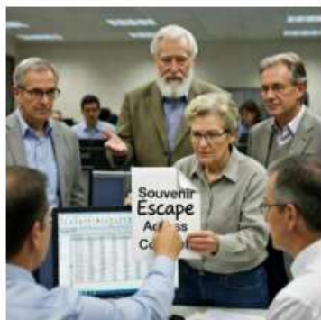
【移行】置き土産Access脱出 カウンセル