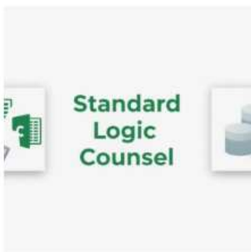
【実務】スタンダード・ロジック カウンセル