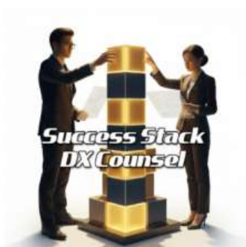
【伴走】サクセス・スタック・DX カウンセル