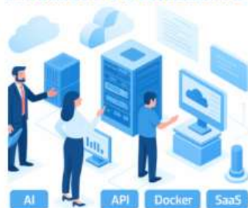
【専門】デジタル・ビジネス・アーキテクチャー カウンセル